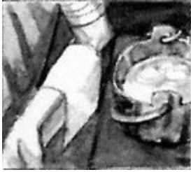
Brijomslagen, de brij bestond uit zemelen, water en mosterd