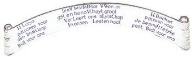
Het opschrift van het Luciakapelletje

"Ergotisme, Antoniusvuur en andere enge ziektes"