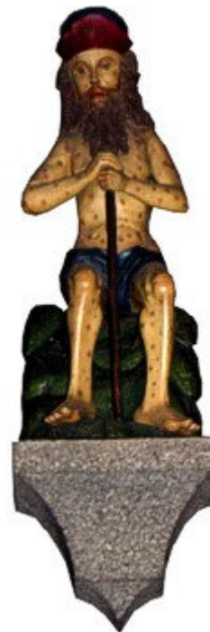
De heilige man Job beschermd tegen zweren en andere huidziektes.