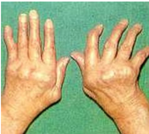
Door reuma aangetaste handen

De telegrafist die steeds maar weer op de seinsleutel moet drukken