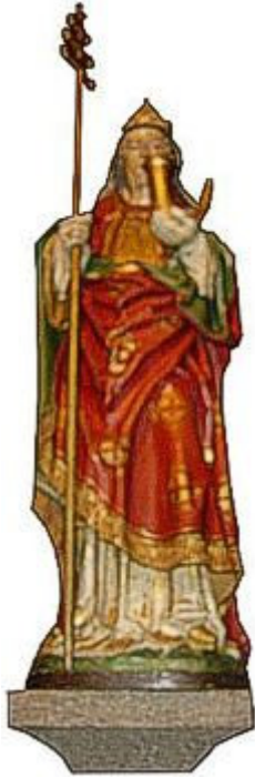
De heilige Cornelis tegen zenuwziektes en plotselinge dood.