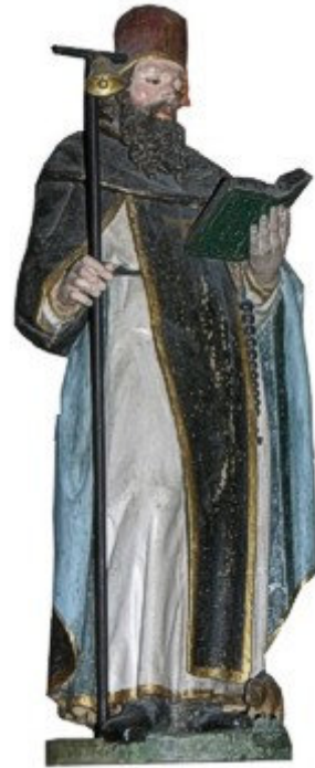
De heilige Antonius Abt zou beschermen tegen de dodelijke jeukziekte ergotisme.