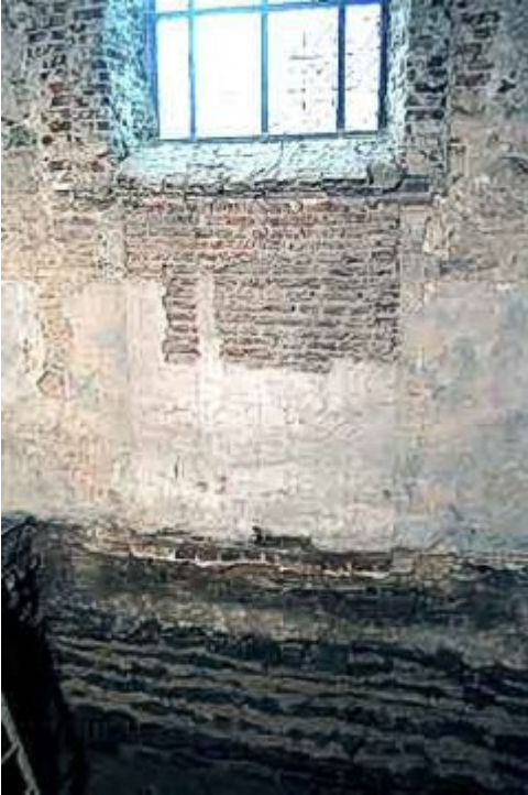
De (dichtgemetselde) lijkdeur van de kerk van Ename, België