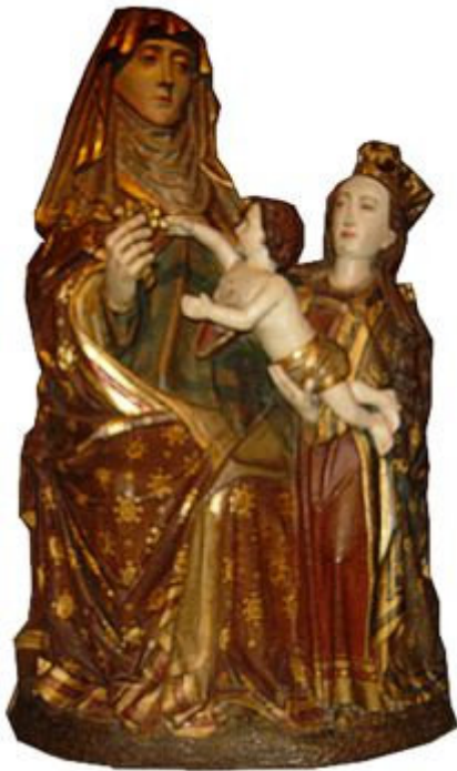
De heilige Anna werd aanbeden om kinderen te kunnen krijgen