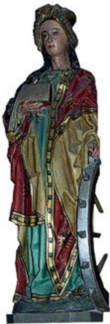
Ook de heilige Catharina beschermde tegen de pest.