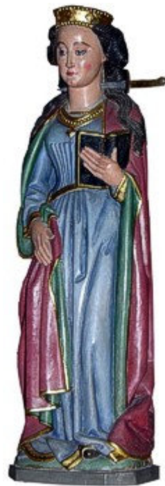
De heilige Lucia werd beschouwd als beschermheilige tegen oogkwalen en vrouwenkwalen.