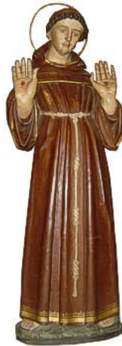
De heilige Franciscus beschermd tegen blindheid en hoofdpijn.