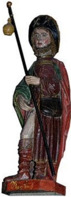
De heilige Rochus was beschermheilige tegen verschillende besmettelijke ziektes waaronder de pest.