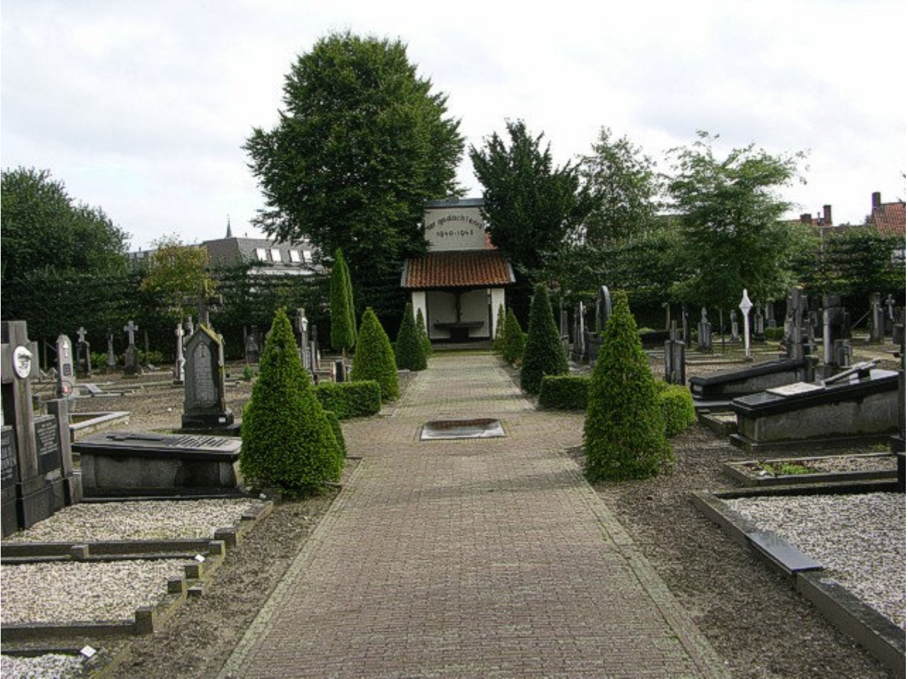
Blik op het oude, pas gerestaureerde kerkhof van Horst. Op de achtergrond het monument voor de Horster slachtoffers van de 2e Wereldoorlog.