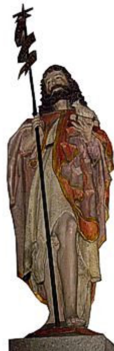
de heilige Johannes de Doper zou beschermen tegen keelpijn en